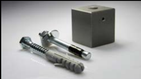
Befestigungsset für unsichtbare Befestigung auf Randsteinen oder sonstigen Pflasterböden.

Das Befestigungssystem ist modular und in hochwertigem Edelstahl ausgeführt. Mit wenigen Handgriffen lässt sich die gewünschte Befestigungsvariante realisieren.