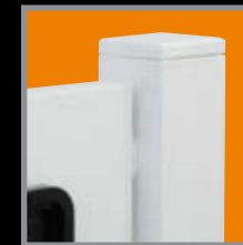
Pulverbeschichtet im RAL-Ton Ihrer Wahl

Das ParkSign®-Trägersystem ist in hochwertigen Oberflächen-Ausführungen erhältlich. Neben den zwei eloxierten Varianten ist jeder RAL-Ton in Pulverbeschichtung lieferbar.