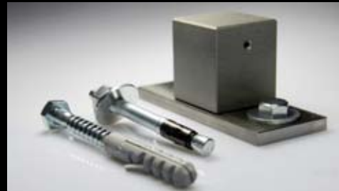
Befestigungsset für höhere Beanspruchung auf allen Teer- oder Pflasterböden.