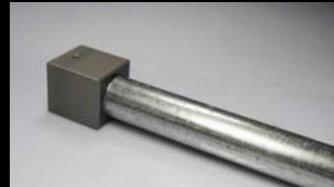
Befestigungsset zum Einbetonieren oder zur Sandverfüllung in eingelassenen Röhren.