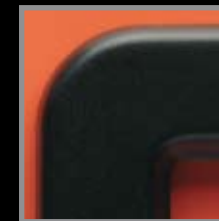
Edelstahlrahmen schwarz pulverbeschichtet

Die ParkSign®-Rahmen aus hochwertigem Edelstahl werden in vier Ausführungen angeboten. In Kombination mit den Oberflächen-Varianten des ParkSign®-Trägersystems eröffnen sich so vielfältige Gestaltungsmöglichkeiten, angepasst an das Erscheinungsbild Ihres Unternehmens.